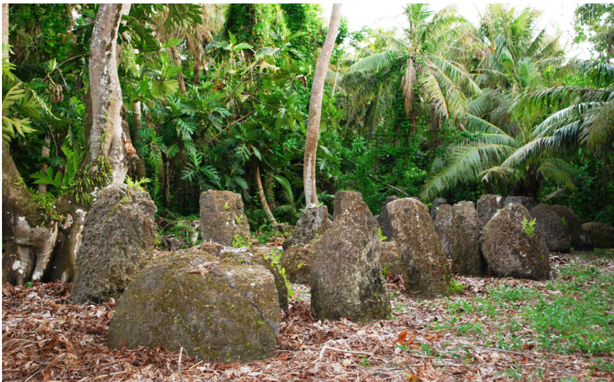
I Sengsong Latte Mochong, i Chamorro archeological nã lugâtn mã identifikã kumo nasionât siknifikâsion ña gi durântin eskâleran inistudia.