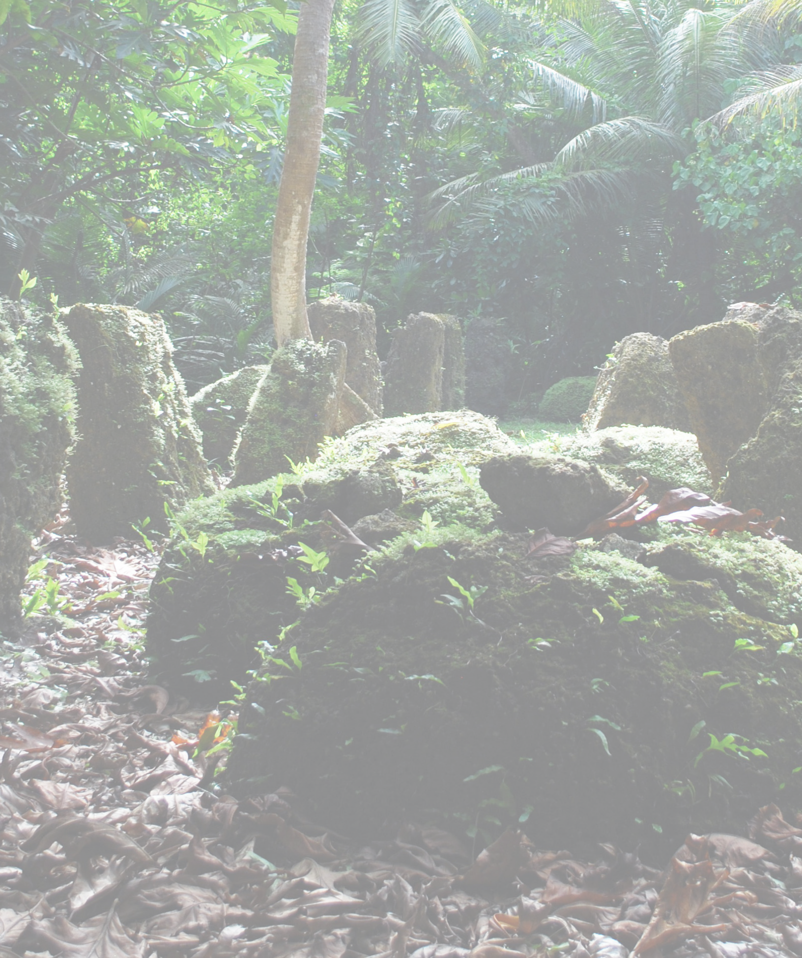
I Sengsong Latte Mochong, giya Luta, Litratu: NPS.