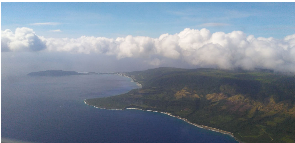
Litrātu ginen hilo' pãpa' gi islan Luta guatu gi Laderan Taipingot osino Wedding Cake.