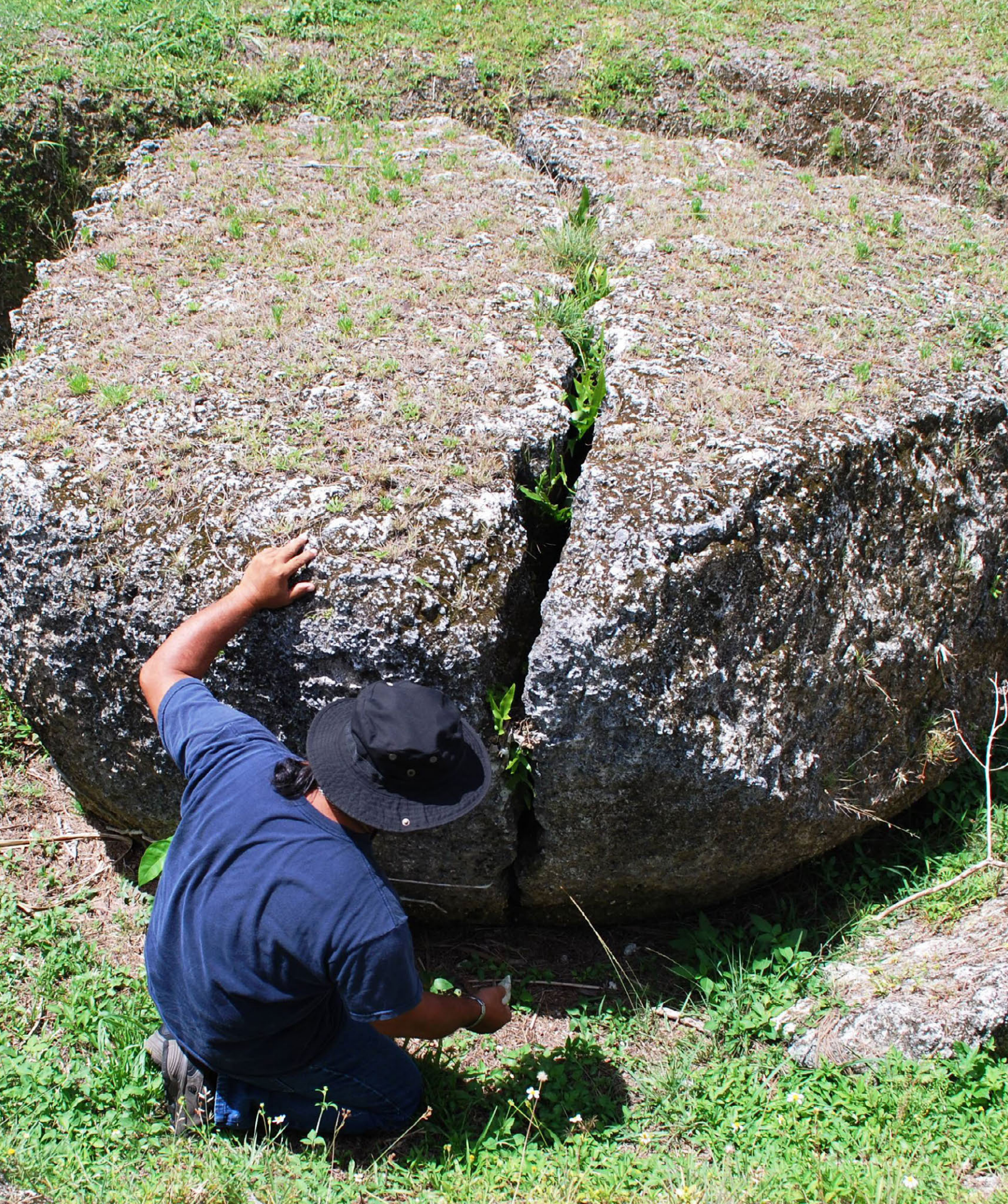
CNMI Historic Ofisinin Konsetbā i empliāo hā rekononosi i dānkulu nā tāsān i latte giya As Nieves Kuari, Luta.