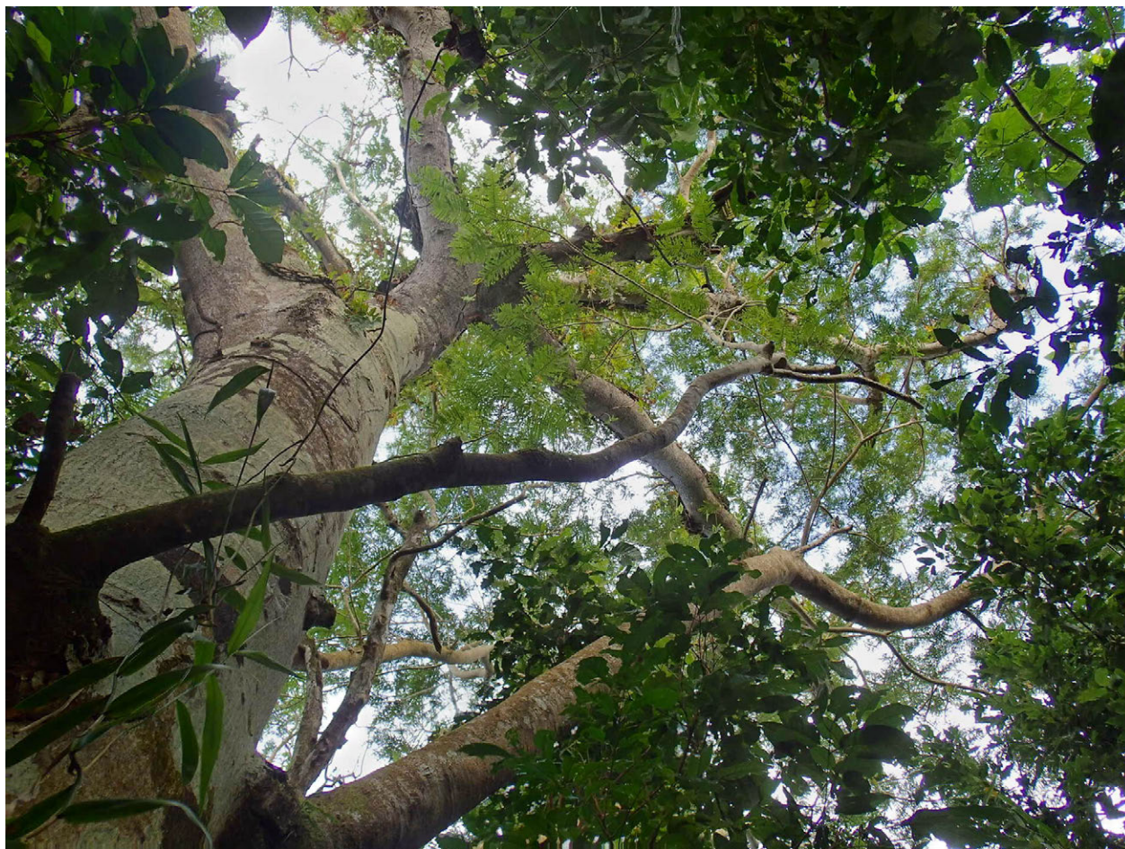
I liträtun tronkun hãyu nai siña ha' mafnas ( Serianthes nelsonii ) gi ácho' hãlom tâno' kaskão giya Luta, Litrātu: Ann Marie Gawel.