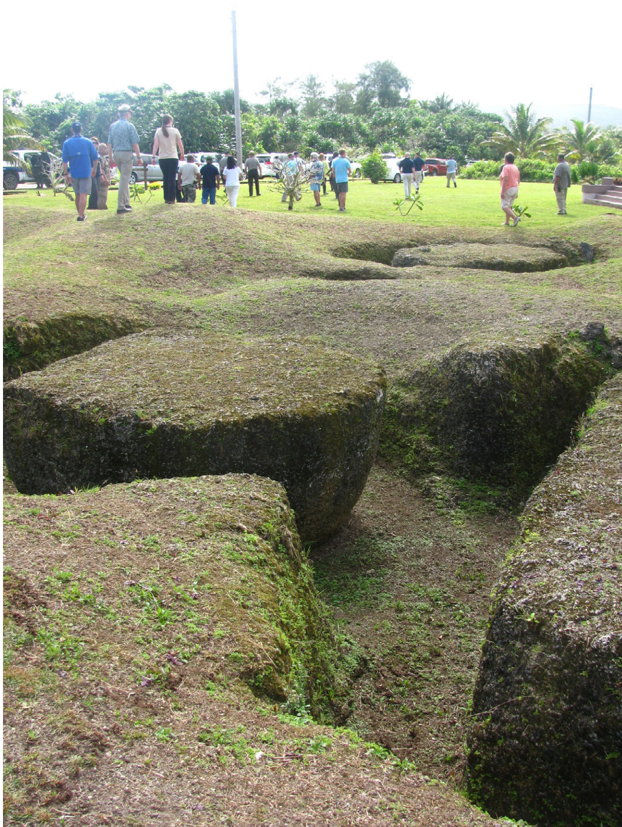
Membru siha ginen i san pãpa' nã guma' Estados Unidos (U.S. House of Representatives) I Kumitê gi Frenkas Naturât mã bisita i As Nieves Kuary, Febreru 2017.