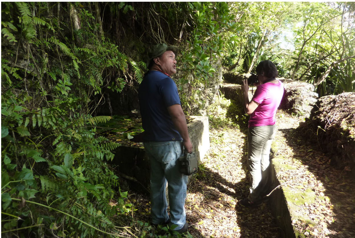
Membro ginen i NPS nã gurupo yan i tãotão i ofisinin CNMI Historic Konsetbã mã bisita i lugât giya Ginâlâñgan sagan i fan âtuk Chapanis gi geran dos.