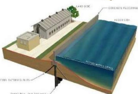
Ejemplo de barrera costera

La participación del público es un elemento importante del proceso de planificación y fomentamos que compartan sus ideas, preocupaciones, sugerencias y temas potenciales para poder considerarlas.