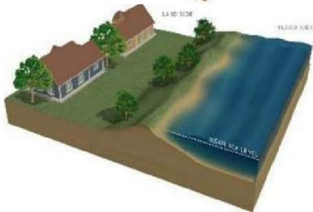
Ejemplo de estabilización costera